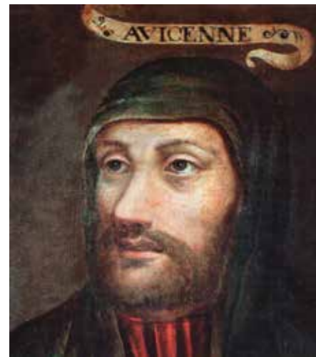
El sustantivo "Medicina" debe su origen al célebre médico persa Avicena. Retrato de Ibn Sina (Avicena), Facultad de Medicina, Universidad de París.

Hace 15 años hice un viaje de peregrinación profesional a Irán con el fin de conocer los centros de enseñanza del doctor Avicena, personaje muy destacado en la historia de la medicina.