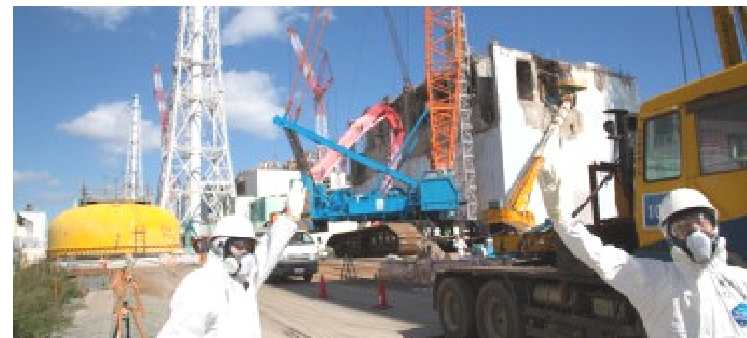
Takashi Ozaki, fotógrafo independiente, publicó fotos de la planta de energía nuclear de Fukushima Daiichi. http://es.globalvoicesonline.org/2012/11/28/fotos-de-la-planta-nuclear-de-fukushima-daiichi/

D2, que consta de un protón y un neutrón). Pero también se logró esta fusión o desintegración del átomo de litio mediante el uso de distintos núcleos atómicos, p.ej. protones muy energéticos y posteriormente neutrones. Este experimento se logró efectuar en Gran Bretaña y Alemania.