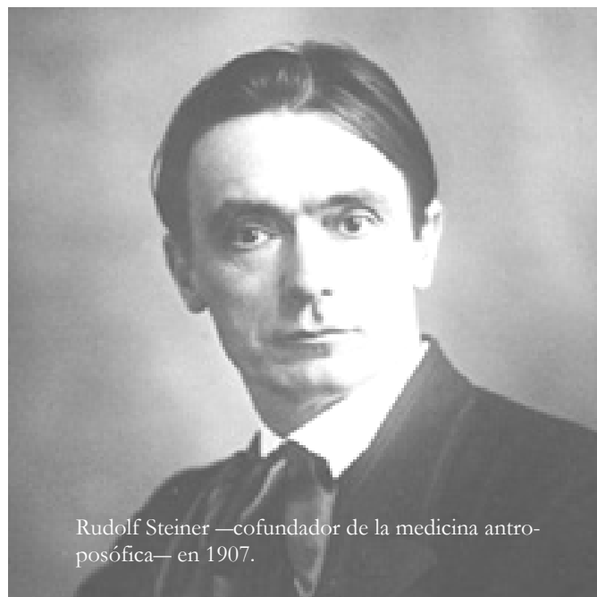
Rudolf Steiner —cofundador de la medicina antroposófica— en 1907.

El individuo crece, se torna más amplio, más rico, más pleno, más entero, abierto a la veneración y a la belleza, abierto a lo que puede haber de mejor