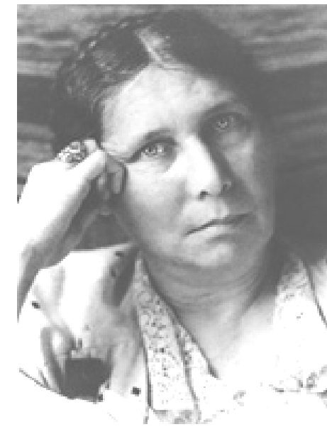
Ita Wegman —cofundadora de la medicina antroposófica— a los 45 años.

*Resiliencia se define como la aptitud del individuo para resistir y recomponerse delante de las agresiones. El término tiene relación con la resistencia