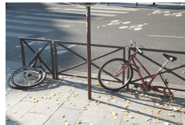
El lamentable destino de una bicicleta en París.

Es injusta una medicina que promete todo tipo de garantías al paciente y para la que no hay nada irrealizable pues le confunde despertándole falsas esperanzas. Una medicina humana debiera