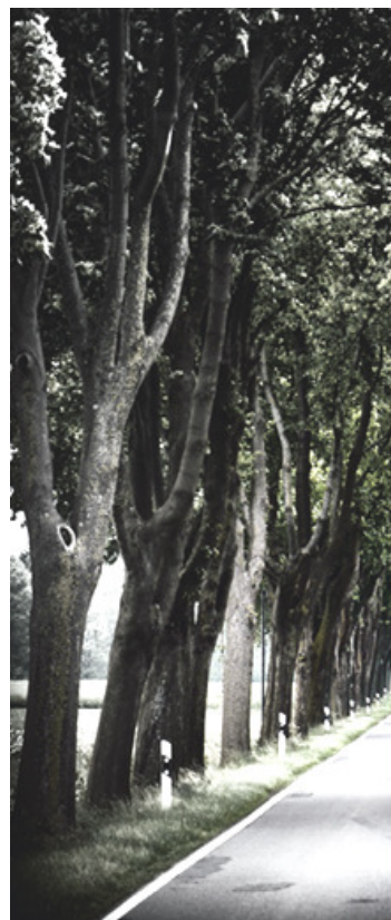
Sigue tu camino... otro no lo hizo.

En vez de eso, debería concienciarse de que nuestro destino no sólo consiste en lo que nos ocurre sino en cómo nos comportamos en el "estar y ser aquí". Lo que nos viene no es ni mucho menos la realización del destino, sino la tarea de cómo reaccionar ante él de modo que, en vez de rechazarlo, nos realicemos como seres humanos enteros. El filósofo Schopenhauer dio en el clavo al describir así el destino: "El destino baraja las cartas pero