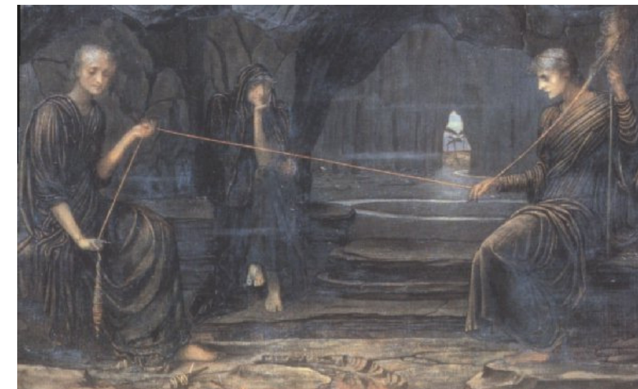
Las Normas nórdicas son las tres diosas del destino, similares a las Parcas griegas. Controlan el destino de los dioses y los hombres, que no dejan conocer. Son Urd (que simboliza el pasado), Verdandi (el presente) y Skuld (el futuro). Viven bajo las raíces del árbol de la vida Yggdrasil.

Parece que destino y medicina son dos conceptos incompatibles entre sí. Pues la medicina nació para combatir una suerte inamovible, la enfermedad, mientras que al destino le caracteriza lo inesperado. Esto es justo lo que el hombre actual no quiere permitir. Su visión de la vida consiste por lo tanto, en programación, control y garantías de seguridad.