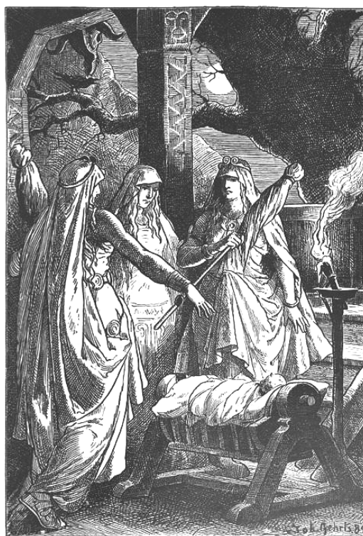
"Die Nornen" (1889) de Johannes Gehrts. Las tres nornas rodean a un niño. http://en.wikipedia.org/wiki/File:Die_Nornen_(1889).jpg by Johannes Gehrts.jpg

La idea sana de que la vida es, a pesar de todo, un regalo en su "ser-como-es", esta evidencia es cada vez más rara de encontrar en la actual medicina. El engendrar un hijo se va convirtiendo cada vez más en producto de encargo sometible a pruebas de calidad y, por lo tanto, desechable. Pues con el diagnóstico prenatal, la vida es por