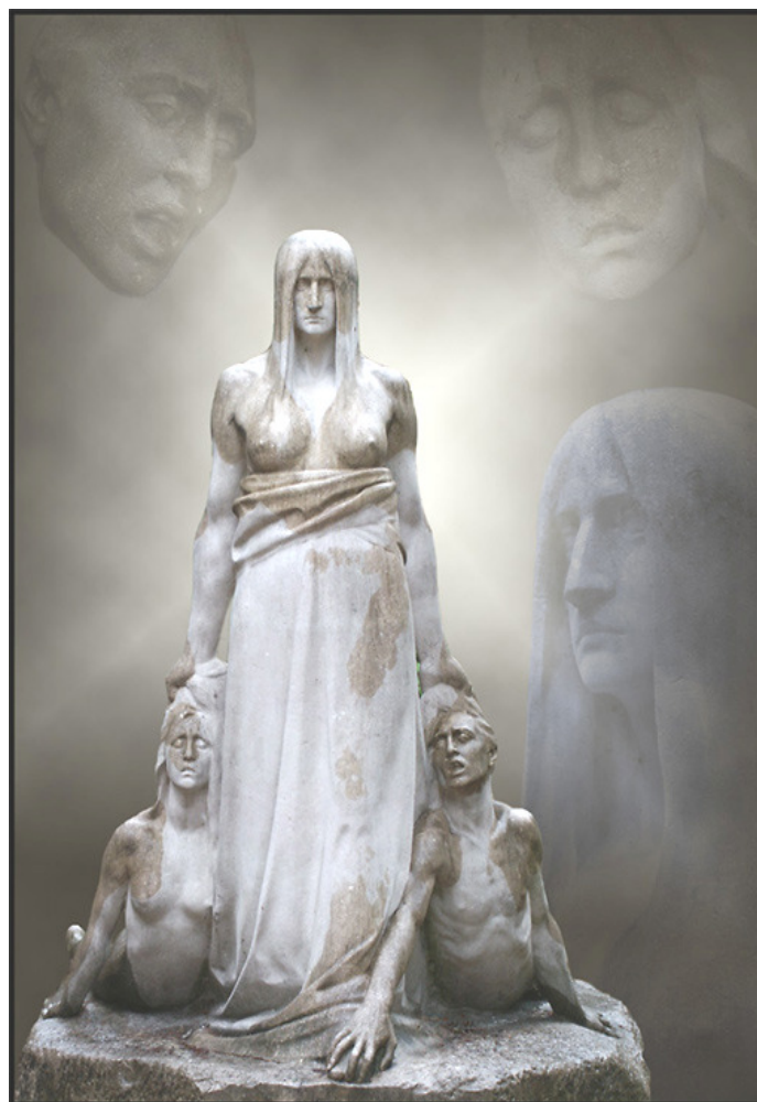
Destino, yo te sigo de buena gana, de no hacerlo, igualmente tendría que seguirte con lágrimas. Friedrich Nietzsche

Si la medicina tiene que ver con medida y con finalidad, a la economía y a la tecnología les son inherentes lo opuesto: la desproporción y la falta de meta. Lo característico de estas dos disciplinas es el exceso de medios. La meta central de la medicina, sin embargo,