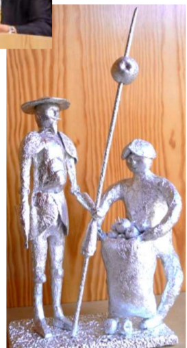
Presentación de nuestro regalo: Don Quijote con la manzana de Guillermo Tell en la lanza y Síncho aprovechando las manzanas: Colaboración Hispano-Suiza...