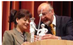
30 Aniversario de Anthrosana CIH

- Circular informativa del 15 de diciembre sobre "La disponibilidad de los medicamentos en España". Esta circular se suscitó ante las dificultades de los pacientes para adquirir los medicamentos y también la difícil situación de los médicos ante ese problema. A raíz de ello hemos asistido, semanas después, a dos intensas jornadas de trabajo en el laboratorio de cara al nuevo registro de medicamentos y a defender las reclamaciones de pacientes y prescriptores. Tenemos la impresión de que Weleda muestra buena voluntad y de que se inician pasos positivos.